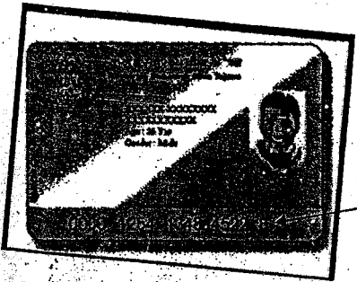
17 अंकों का राष्ट्रीय स्वास्थ्य बीमा योजना कार्ड आई.डी.